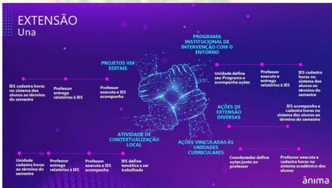
Figura 2: Modalidades de extensão realizadas na UNA:

O Quadro 2 representa a matriz de responsabilidades inerentes à UNA e aos docentes envolvidos em ações de Extensão: